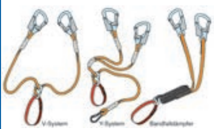
Abb. 2: Klettersteigset-Systeme