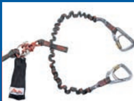
Abb. 6: Das zurückgerufene Klettersteigset

AustriAlpin VertriebsgmbH, Industriezone C 10, A-6166 Fulpmes, Österreich