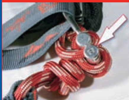
Abb. 7: Der Falldämpfer „T7“