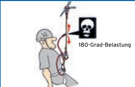
Abb. 3: Klettersteigbremse