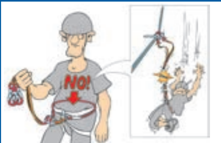
Abb. 4: Klettersteigbremse Durchlauf

Urlauber, Bergwanderer oder Eltern mit Kindern wagen oft an Klettersteigen den ersten Schritt in die Senkrechte. Aber auch Erfarene „rennen“ nach Feierabend gern mal zum Training „durch“ den Steig. Auf eine Sicherung wird verzichtet, man hat alles im Griff. Von 2000 bis 2006 hat sich jedoch die Zahl der Klettersteigunfälle verdoppelt. Ein leicht zugängliches, scheinbar sicheres Abenteuer ohne viel notwendige Erfahrung oder Schulung lockt. Stahlseile und Eisenleitern im Fels täuschen Sicherheit vor. Dass beim Klettersteiggehen neben guter Kondition und Schwindelfreiheit auch Sicherungstechnik, Gefahren und die Gesetze der Schwerkraft bekannt sein sollten, zeigt der folgende tödliche Unfall.