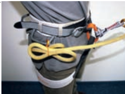
Abb. 5: Bremsseil verstauen

Norm geforderten Grenzwerten entsprechen. Der maximal auftretende Fangstoß darf 6 kN nicht überschreiten. Auch dürfen Klettersteigsets laut Norm nicht in die Bestandteile zerlegbar sein. Alle Verbindungen sowie die Seilösen für die Karabiner müssen vernäht sein.