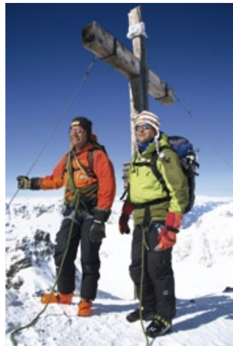
Staunen über die Aussicht am Gipfelkreuz des Piz Buin.