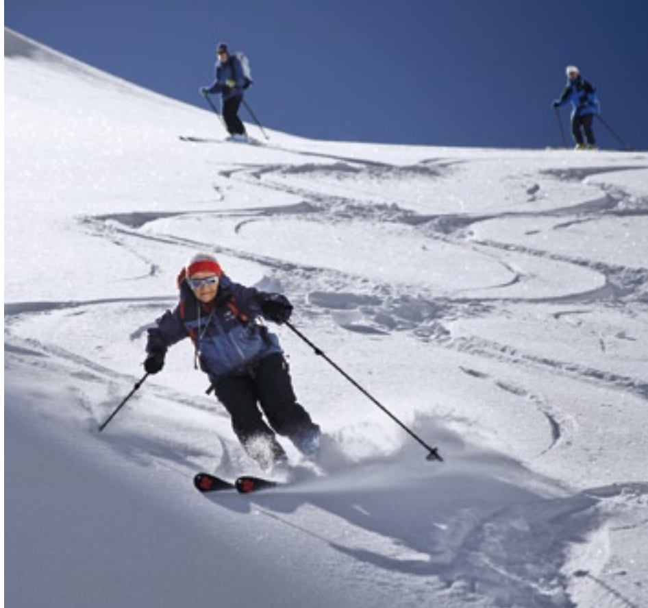
Schier endlose Abfahrten machen die Silvretta zu einem Skitoureneldorado.