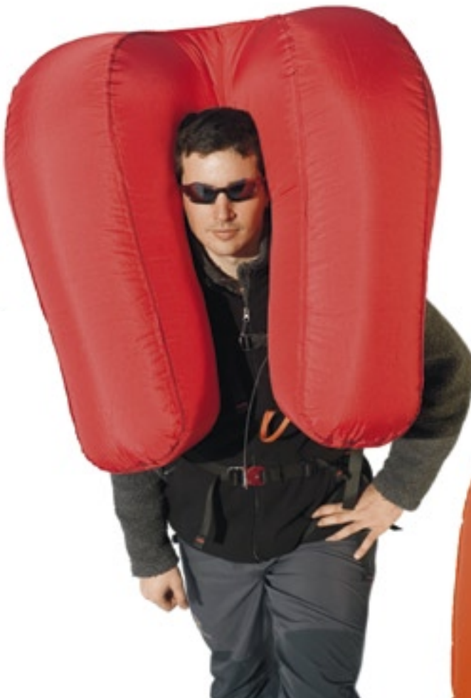
Der Airbag macht den Schneesportler zu einem grossen «Schneebrocken», sodass er an der Oberfläche bleibt. Airbagsystem Snowpulse, ausgelöst und aufgeblasen (150 l).

In den zehn Jahren der Auszählungsperiode wurden gemäss SLF-Datenbank 120 Fälle aus Europa bekannt, bei denen das Airbagsystem zum Einsatz kam. Dabei überlebten 114 Personen (95%) den Lawinenniedergang und konnten sich entweder selbst befreien oder wurden von ihren Kameraden dank dem sichtbaren Airbag aus dem Schnee befreit. Eine Person wurde durch eine sekundäre Lawine ganz verschüttet und überlebte nicht, fünf Personen zogen die Airbag-