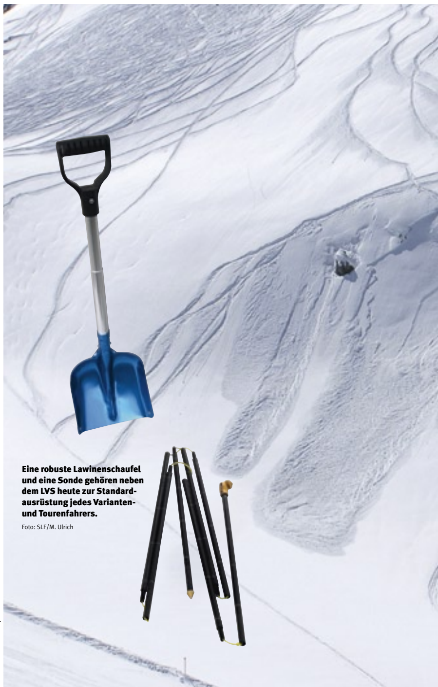
Eine robuste Lawinenschaufel und eine Sonde gehören neben dem LVS heute zur Standardausrüstung jedes Varianten- und Tourenfahrers.

Das elektronische Ortungssystem besteht aus Detektor und Reflektoren. Letztere werden bereits in Kollektionen mancher Hersteller integriert (Kleider sowie Ski-/Snowboardschuhe und Helme). Die Reflektoren arbeiten beim Recco-System ohne Batterie. Es sind immer mindestens zwei Reflektoren zu empfehlen (links und rechts oder vorne und hinten), weil das System nicht funktioniert, wenn der Reflektor durch den menschlichen Körper abgedeckt wird. Die Reflektoren sind wartungsfrei und immer ver-