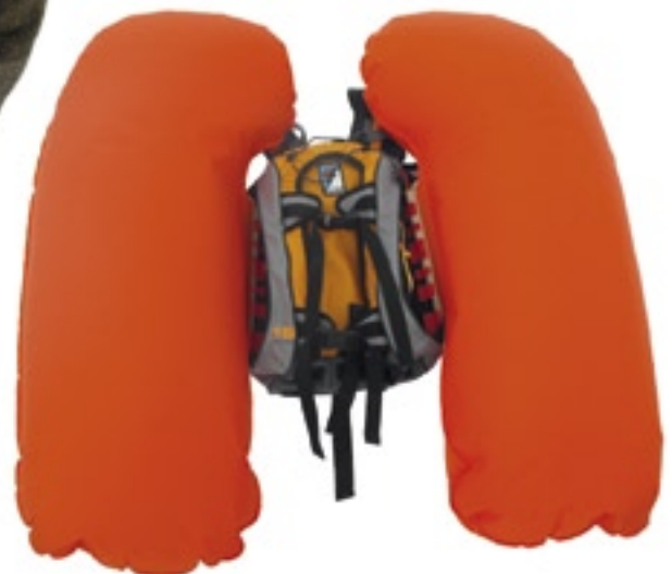
Das Airbagsystem ABS verleiht Flügel, ausgelöst und aufgeblasen hat es ein Volumen von 170 Litern.