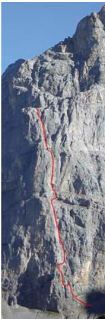
Die Route im Überblick: Sie verläuft etwa entlang der Sonnen-Schatten-Grenze, an der Grenze zwischen Süd- und Westwand.