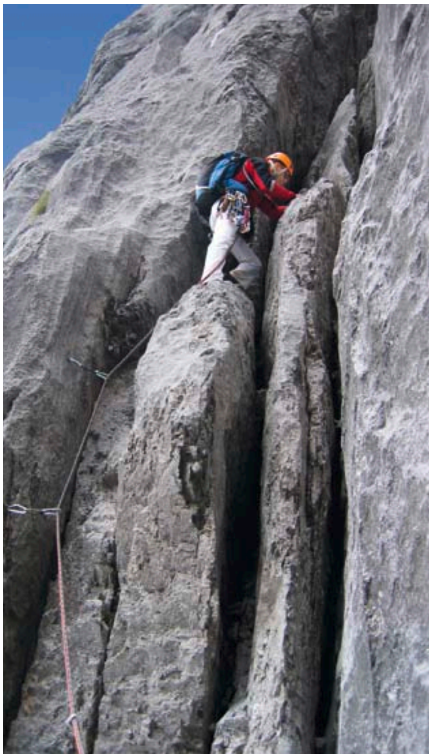
Unterwegs am sanierten Südwestpfeiler des Schlossbergs.