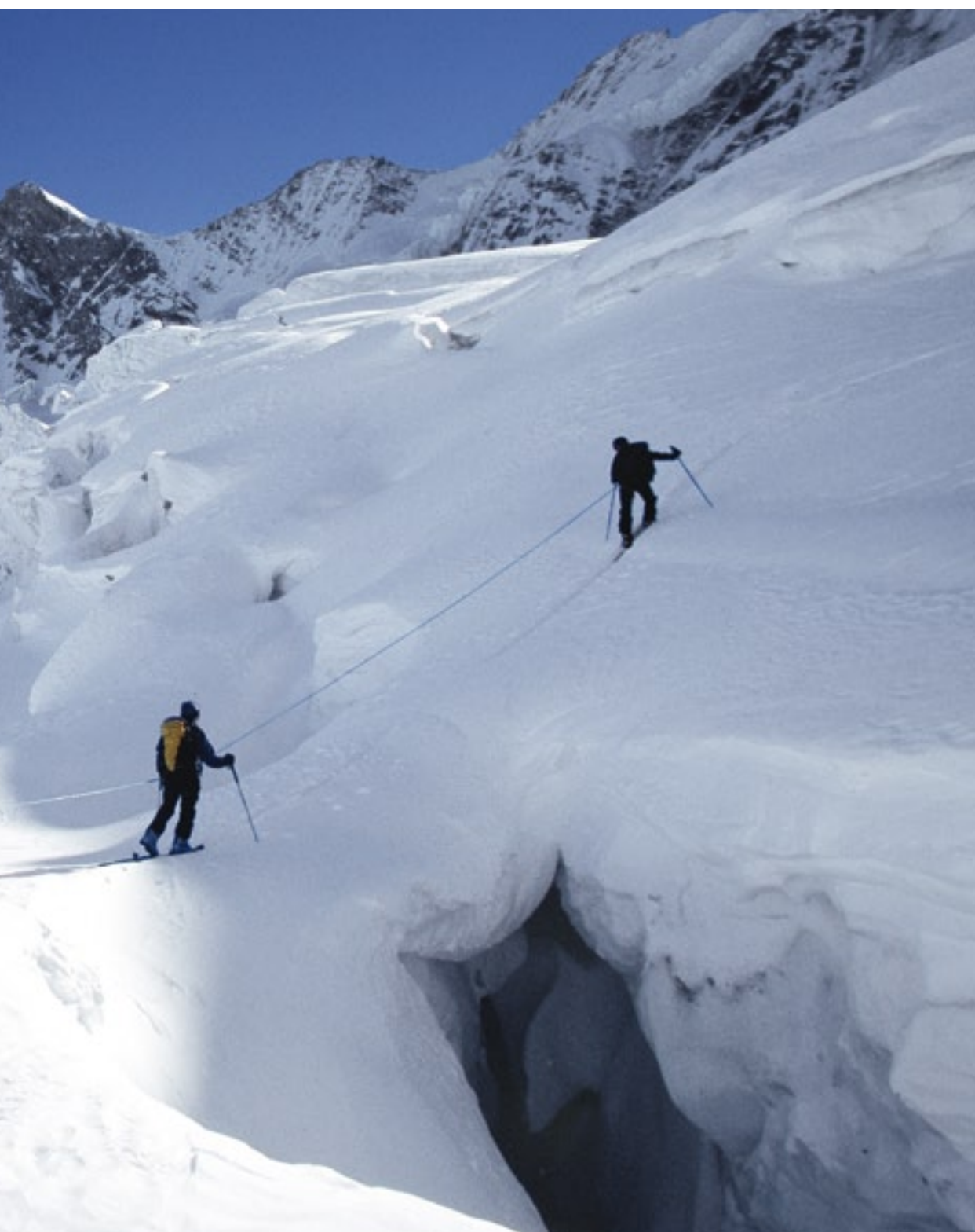
Zwischen der Cabane d'Arpitettaz und der Cabane du Mountet stellt die Überquerung des Glacier de Moming einen Höhepunkt dar. Im Hintergrund das Weisshorn.

durch, um die Ausläufer des Besso (3658 m) zu erreichen. Oder es liegt genügend Schnee, und man kann diese kurze Abfahrt vermeiden, indem man direkt ein erstes Flachstück etwa beim Buchstaben «l» des Schriftzugs «Glacier de Moming» erreicht. Ans linke Ufer des Gletschers in der Falllinie des Besso. Von hier eine Spaltenzone durchqueren, dann nach E das grosse Flachstück bei 3200 m überqueren. Nach Passieren der Séracs nach SW abzweigen und in einem steileren Hang auf die Kuppe südlich des Blanc de Moming (3567 m). Für die Abfahrt folgt man zuerst dem gezackten Grat der Arête du Blanc bis P.3732. Luftige Passage, die man zu Fuss absolviert. Die Abfahrt zur Cabane du Mountet beschliesst in aller Schönheit den Tag.