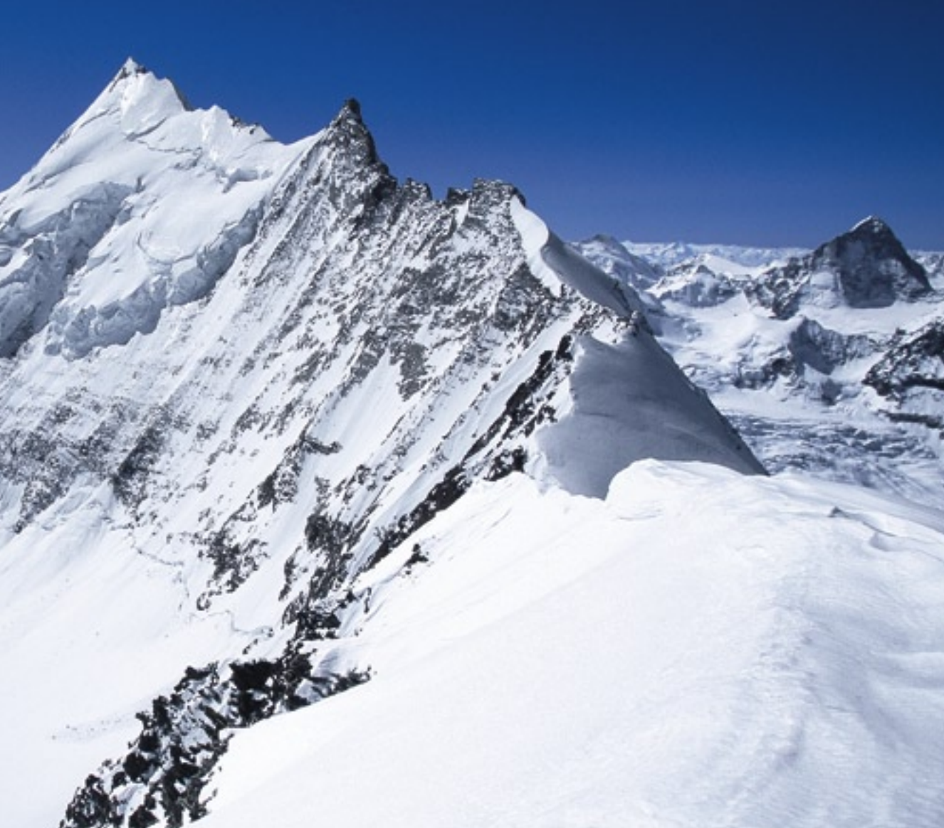
Blick vom Gipfel des Bishorns: die beeindruckende Nordostwand des Weisshorns, das Monte-Rosa-Massiv und die Dent Blanche.