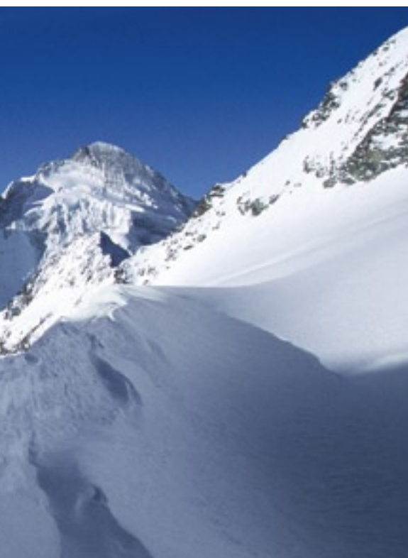
Nach Überschreiten des Col Durand entdeckt man weitere grandiose Landschaften; dann beginnt die wunderbare Abfahrt zur Schönbielhütte.