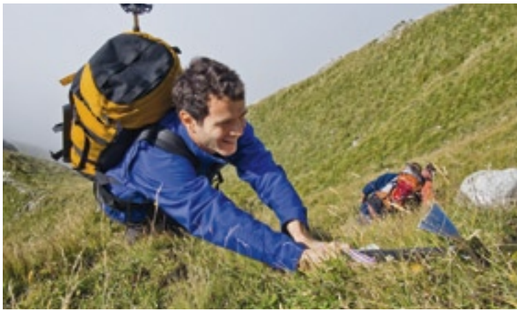
< Auch in steilem Grasgelände kann der Pickel nützlich sein. Auf jeden Fall benötigt man auf den abgebildeten Passagen an der Dent de Brenleire sehr gute Trittsicherheit. Die Schwierigkeit ist T5. v

Mit dem Klettern verwandt sind die Freude am Überwinden von Graten und Flanken, die auf den ersten Blick kein Durchkommen ermöglichen, sowie der Spass an der eigenen körperlichen Geschicklichkeit. Eher dem klassischen Bergsteigen mittlerer Schwierigkeitsgrade entlehnt ist dagegen das Engagement, also die Ernsthaftigkeit und mentale Beanspruchung einer Tour, sowie der Kitzel der gähnenden Leere unter den Schuhsohlen; und die Herausforderung der richtigen Routenfindung. Bei selten begangenen und möglicherweise nirgends beschriebenen Routen gesellt sich noch ein bisschen Erstbegehungsgefühl hinzu.